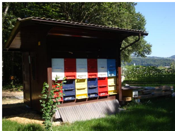
Čebelnjak v vzrejnem centru